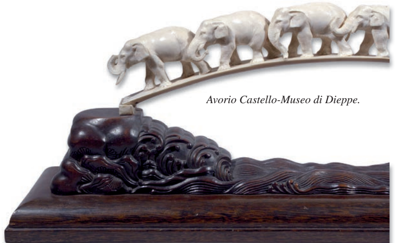
Avorio Castello-Museo di Dieppe.