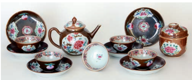
Porcelana, Museo Cie des Indes Lorient.