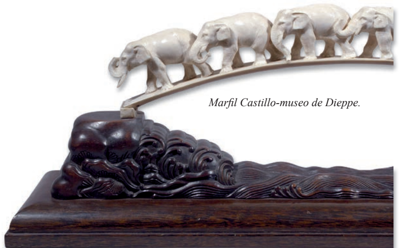
Marfil Castillo-museo de Dieppe.