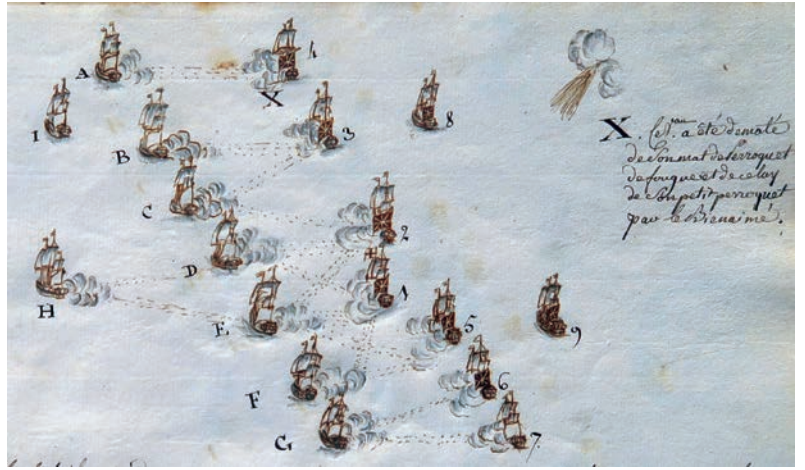
Combat naval de Goudeleur, Aché planche 4, ANOM Aix e Provence.