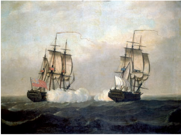
Combat du Pitt contre Saint-Louis, deux vaisseaux de la Cie des Indes