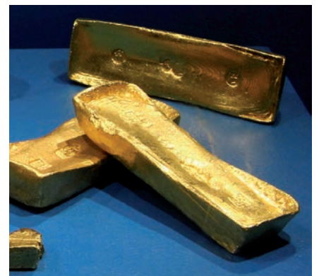
Boite à thé peinte Musée Cie des Indes. Lingot or, Prince de Conti, Drasm