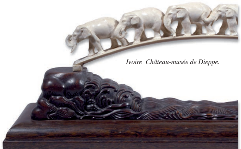
Ivoire Château-musée de Dieppe.