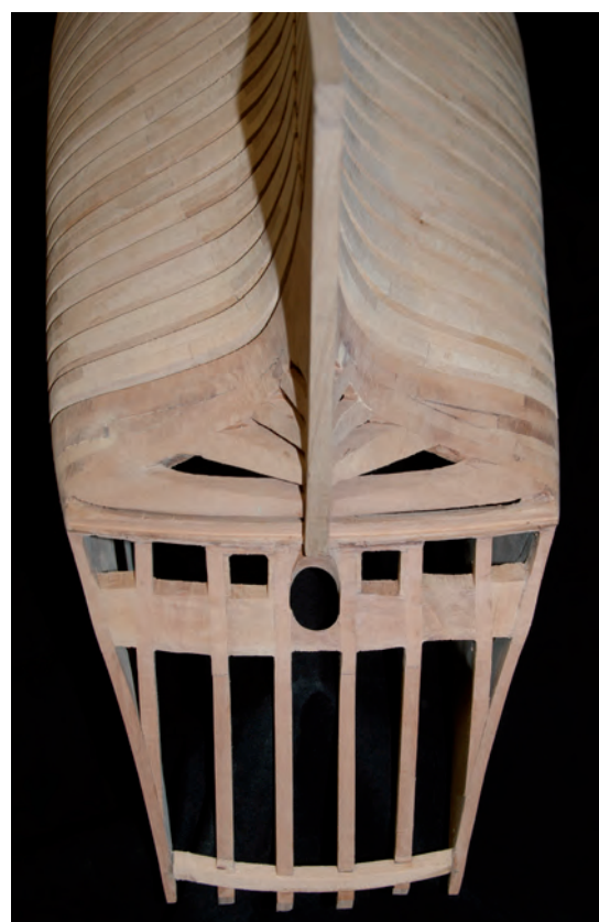
Foto 30 - Particolare dell' specchio di poppa quasi terminato.