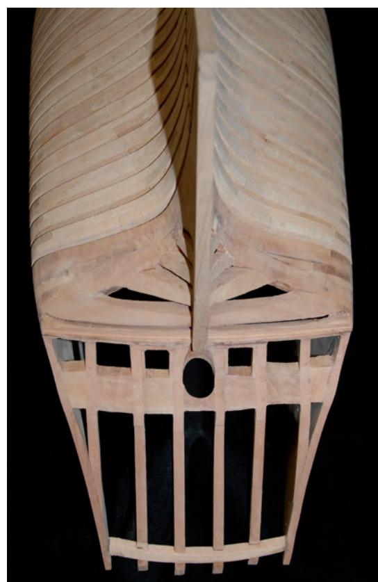
Photo 30 - Détail du tableau arrière quasiment terminé.